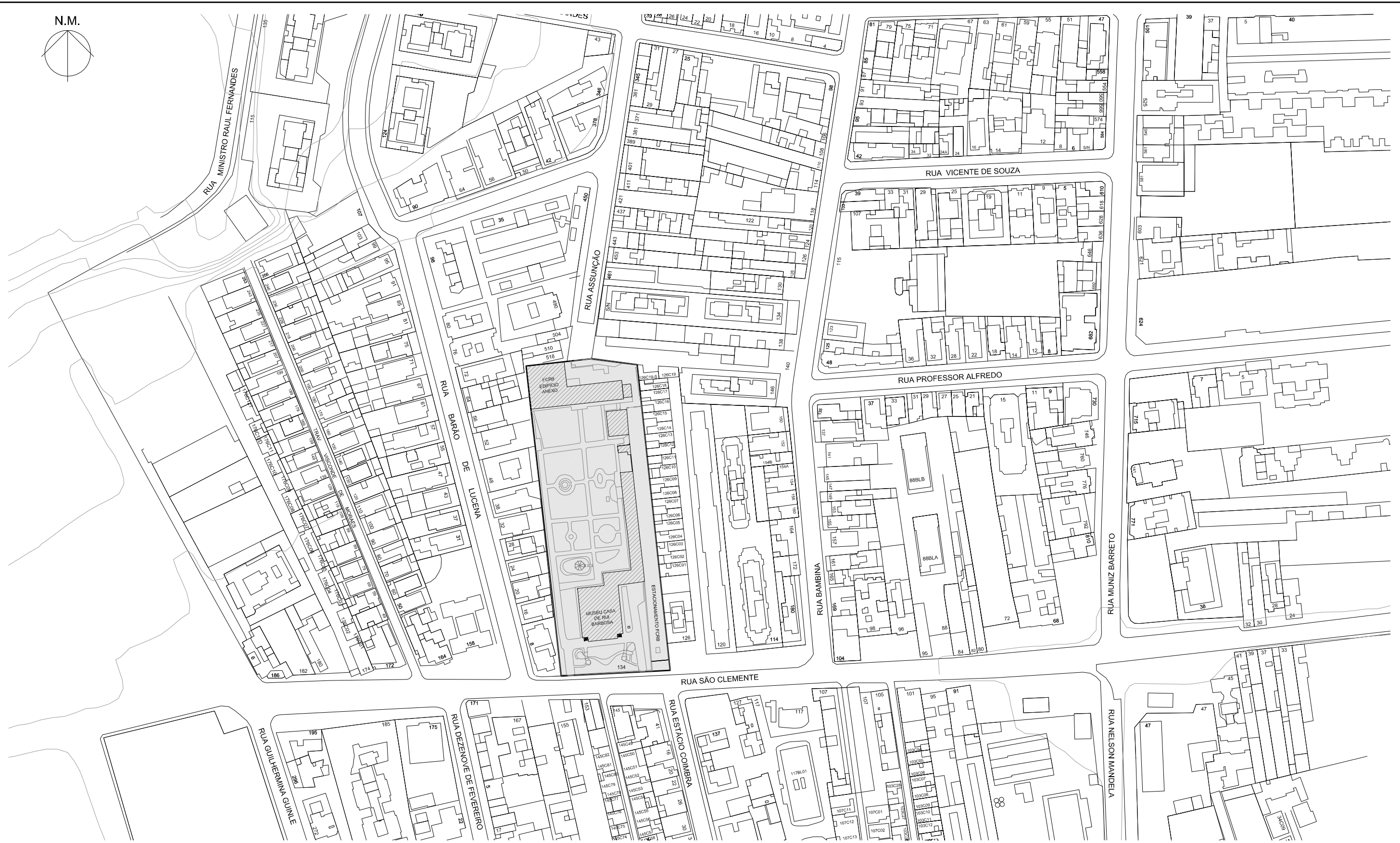
1 PLANTA DE LOCALIZAÇÃO