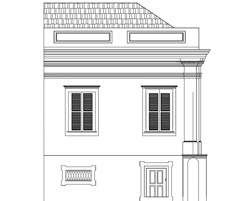
2 FACHADA INTERNA LESTE ESCALA 1:100