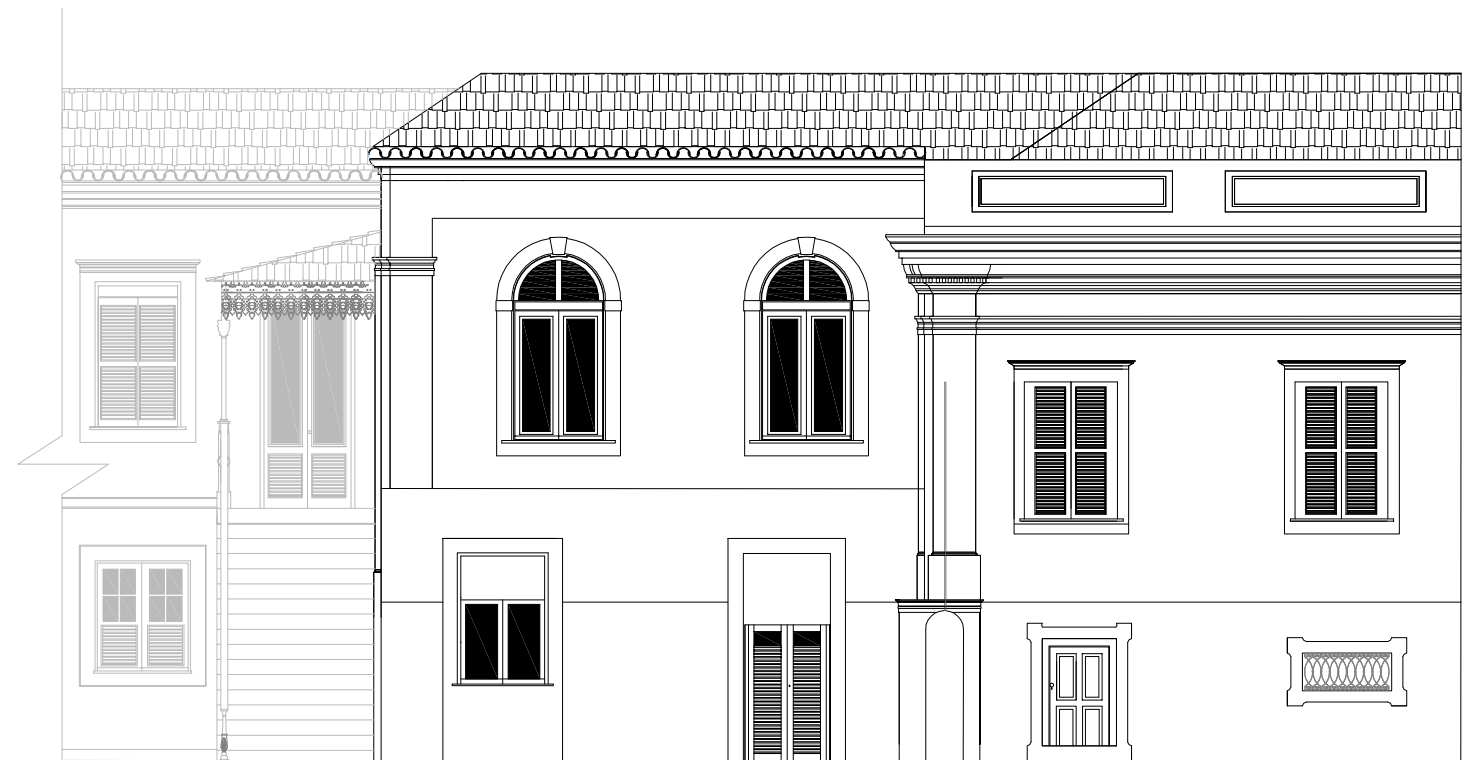
1 FACHADA INTERNA OESTE