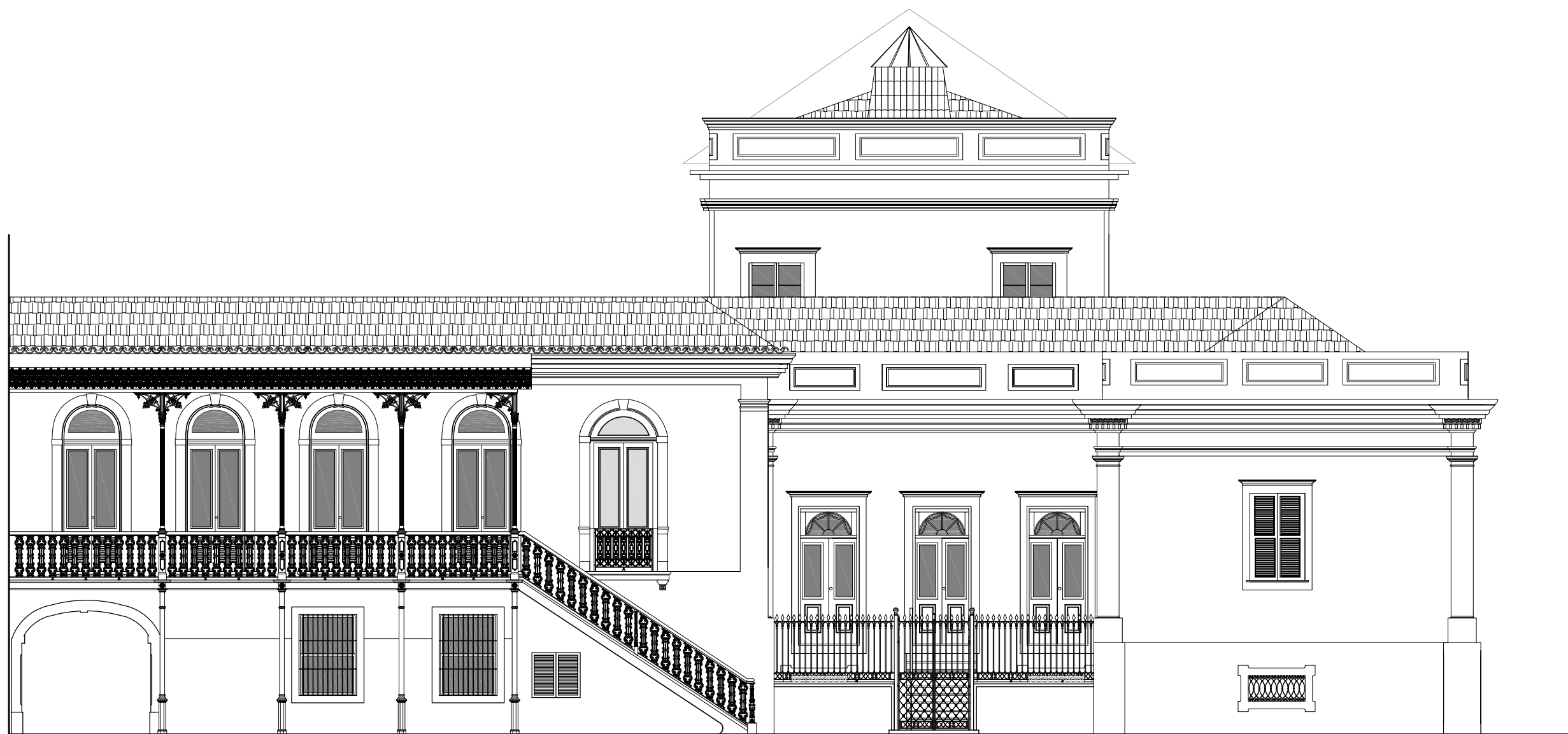
1 FACHADA NORTE